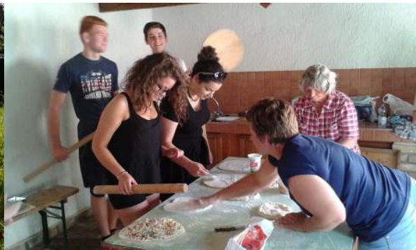
A lányok esete a langallóval