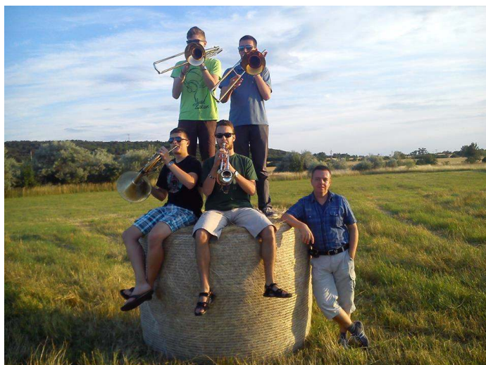
Az ébresztő lemezfelvétele