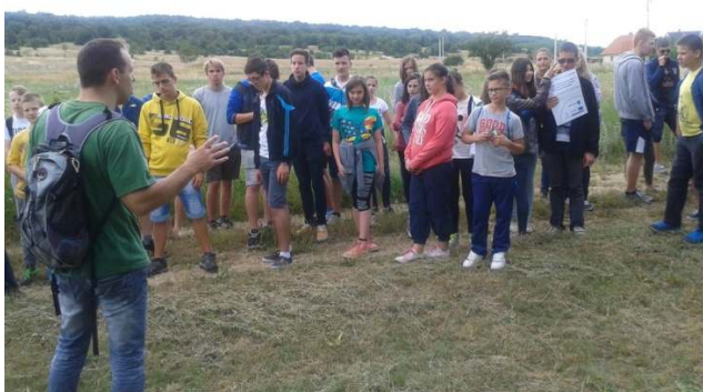
Geológusok vagy zenészek? Neem, ezek zenészek!

Délután a Malom-völgyi túrára indultunk. Itt a résztvevők megismerkedhettek Halimba környékével, a vidék kialakulásának történetével, „Szent László pénzével”, és különböző kőzetekkel, melyek Halimba környékén találhatóak. A szakszerű idegenvezetésről a szálló fenntartói gondoskodtak.