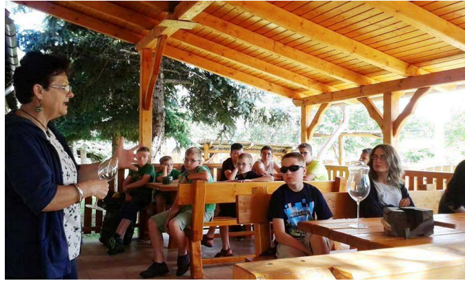
Előadás az üveggyártásról

Visszaérkezés után minden szokásosan folytatódott. Az „öregek” megpihentek, a fiatalok nekiálltak a vége láthatatlan focibajnokságoknak, amiket csak a vacsora kedvéért szakítottak meg.