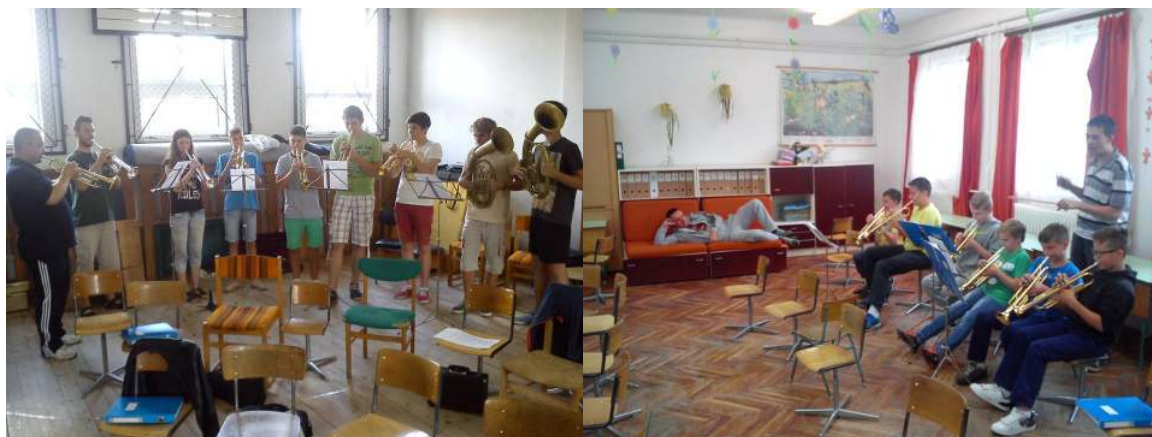
Felcsendült a Bűvös vadász