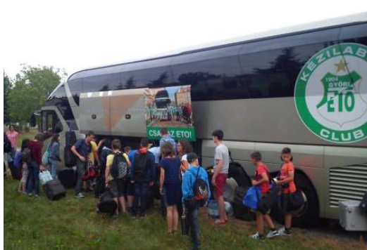
Érkezés a célhoz a bal oldalon

Hetedikfűvóstáborunkat ebben az évben is - a tavalyihoz hasonlóan - az Ezüstoffenyő turisztaszállóban, Halimbán rendeztük meg. 45 gyermek 5 felnőtt kísérelével vágott bele a nagy kalandba, hogy egy hetet együtt, zenéléssel töltsön. Többen törzsvendégként érkeztek vissza az ismerős épületbe. Az előző évekhez hasonlóan, idén is sok új arccal találkoztunk a buszra szálláskor, de ez csak még érdekesebbé tette az előttünk álló egy hetet.