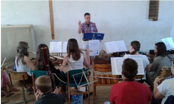
Tambá ígét hirdet

Pénteken már mindenkiben volt egy kis drukk a másnapi koncert miatt, ezért a felkészülések még nagyobb intenzitással folytak. Ez volt az utolsó lehetőség a hibák kijavítására és a darabok tökéletesítésére. Ez Tambá mozdulatain is megmutatkozott. Most éreztük, hogy „De jó lenne még egy napot gyakorolni!”