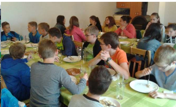
Az első ebéd

Az idei táborot pályázati keretektől finanszírozta a Zeneiskola, így az odautazást az eddigiektől eltérően busszal oldottuk meg, és már reggel el tudtunk indulni. Már a buszon elkezdődtek a hét szellemiségét meghatározó traccs partik.