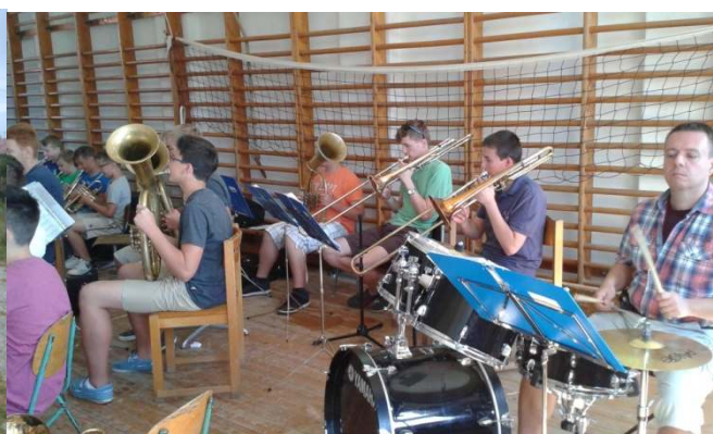
Szorgos népünk győzni fog!!!

A próbák három részből álltak: teljes zenekari, nagyok zenekara és kamara. Idén három darabot újítottunk fel, és egy újat tanultunk: az Olympicspirit, a Rocopoco, és a Marchforyoung eljátszása az egész zenekarnak nagy élmény volt. De a nagyok a MomentforMorricone megtanulásával sokat küzdöttek.