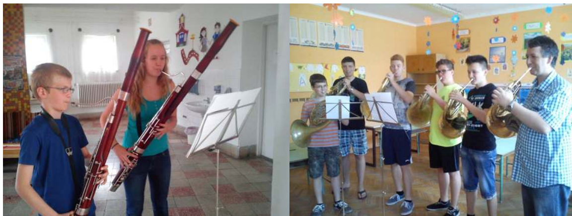
Fagott és kürt kamara