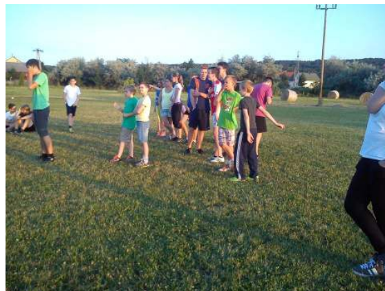
És a fiatalok