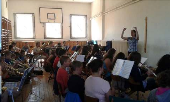
A segédkarmester beint

A délelőtti zenekaros és kamarás próbák után a fűvészkertbe látogattunk el, melyet Szalai Miklós egykori esperes plébánosról neveztek el. Uzsonnára megkóstolhattuk a híres halimbai langallót, amit fuvolista lányaink segítségével készítették. Nagyon finom volt, csak KEVÉS!!!