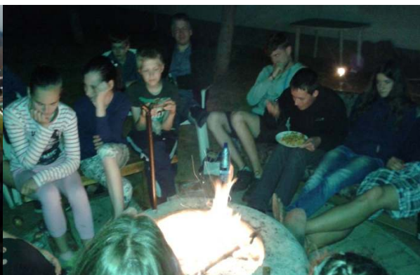
Este a tábortűznél