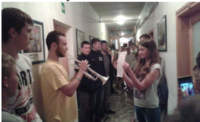
II' Silenzio Márk előadásában